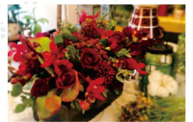
*실제 작품은 상기이미지와 다름